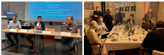
Eindrücke von der Jahrestagung 2023