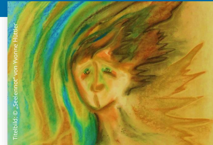
Titelbild: © „Seelenmot“ von Yvonne Hüttler